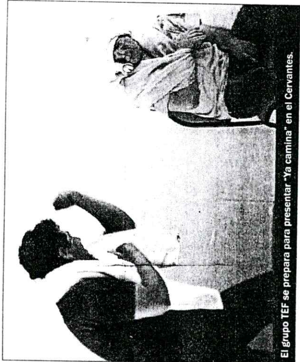
El grupo TEF se prepara para presentar “Ya camina” en el Cervantes.