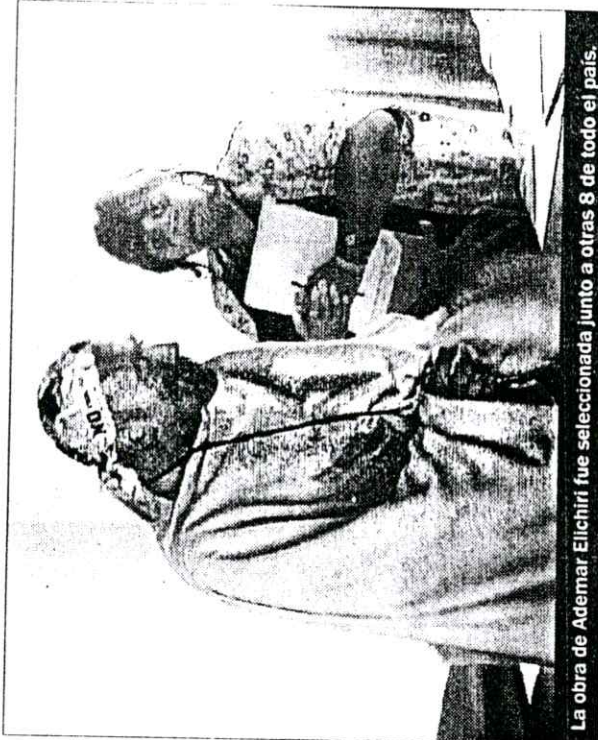
La obra de Ademar Elichiri fue seleccionada junto a otras 8 de todo el país.

Comentó que la obra “cuenta la historia de unos perdedores que apoyándose mutua-